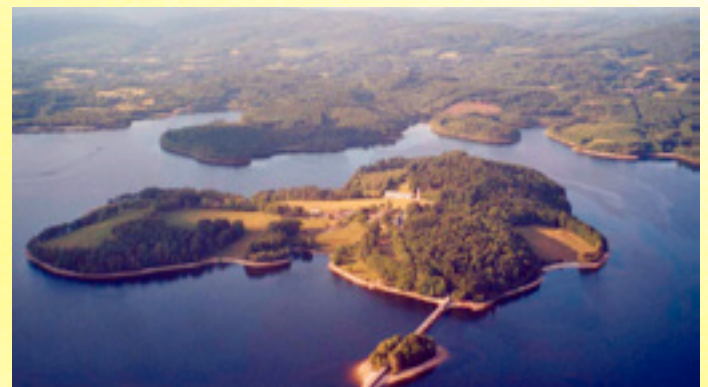
Île de Vassivière (Creuse)

Située en plein cœur d'une région magnifique, à 3 heures de Paris, à 2h30 de Bordeaux, Toulouse et de l'océan, Limoges bénéficie d'un cadre de vie apaisé et d'un environnement naturel exceptionnel.