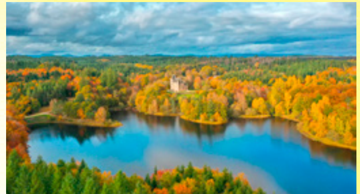
Château de Sédrières (Corrèze)

La Région Nouvelle-Aquitaine place la création au cœur de sa stratégie de développement culturel et économique. C'est dans ce contexte que se développe le projet artistique et culturel du Frac-Artothèque Nouvelle-Aquitaine qui ouvrira un nouveau site au printemps 2023 en hyper-centre de Limoges dédié à la création contemporaine.