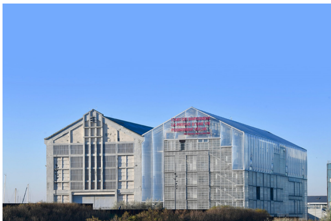
FRAC Grand Large, Dunkerque, Hauts-de-France