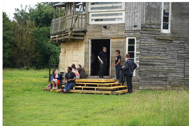
Wysing Arts Centre, Cambridge, Angleterre