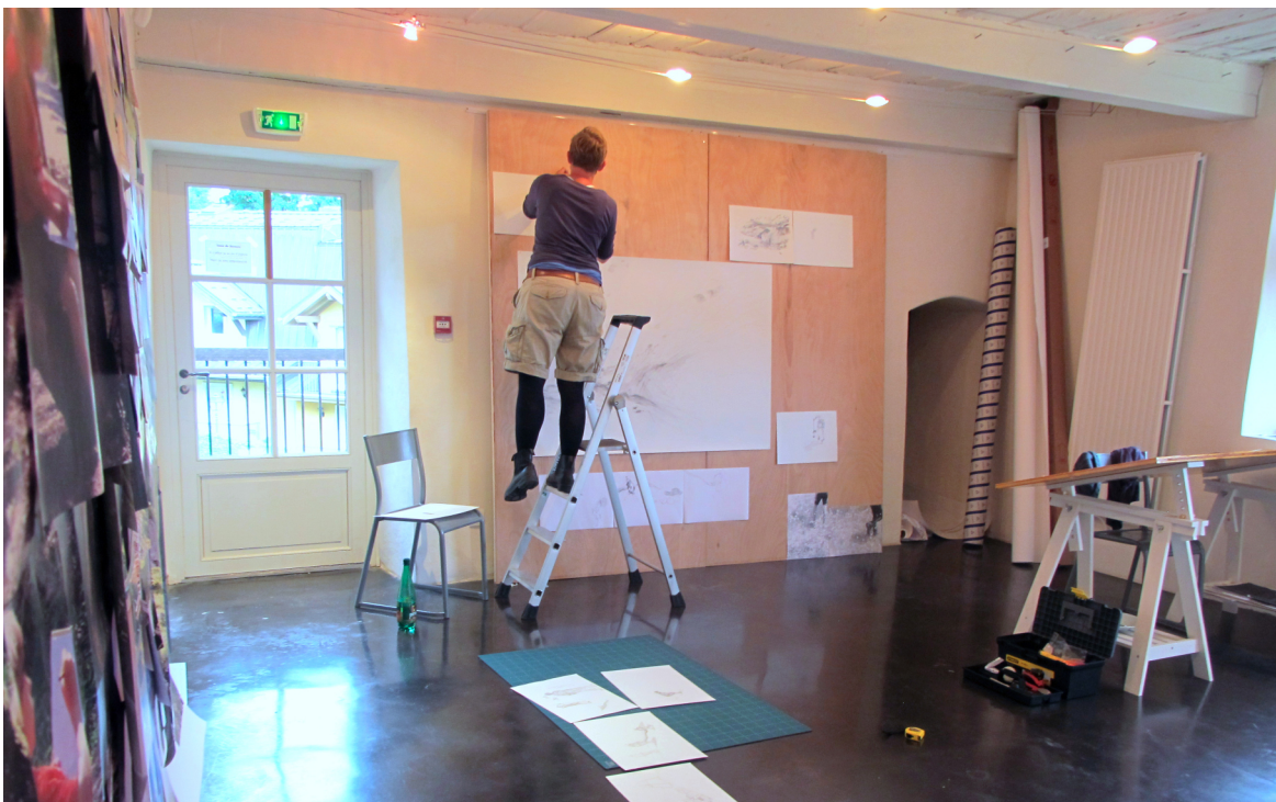
Vue de l'atelier - résidence Géraldine Trubert