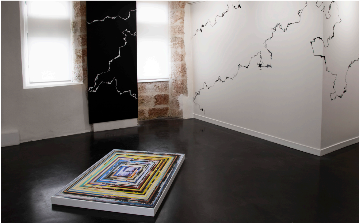
Vue de l'atelier - exposition Bird-Watchers