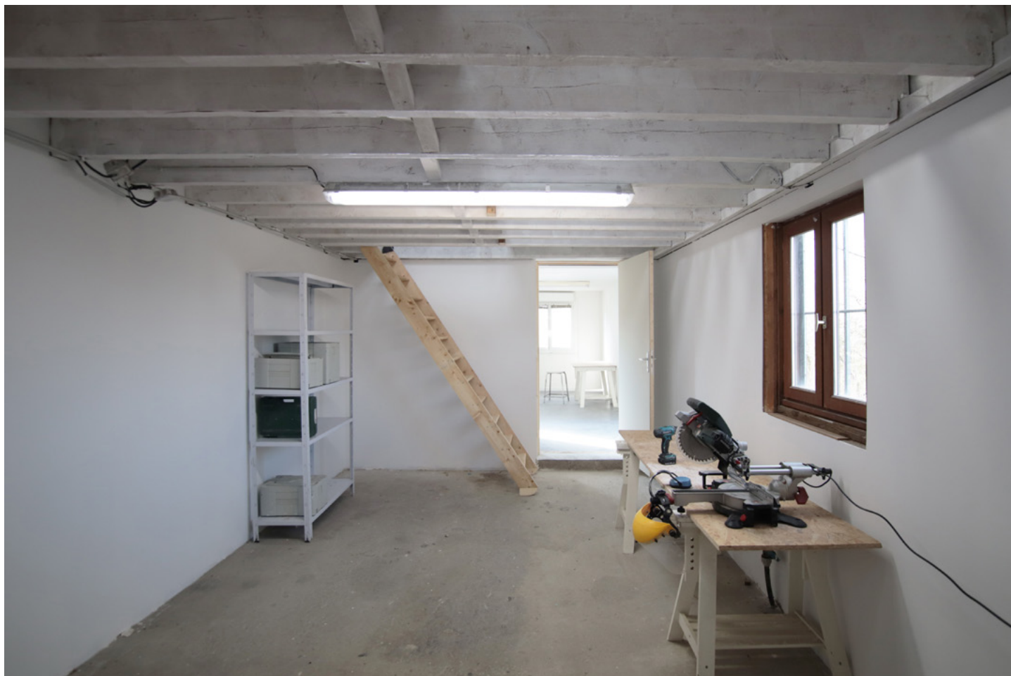
Vue espace atelier résident

L'hébergement éventuel, les déplacements et les frais alimentaires restent à la charge de l'artiste.