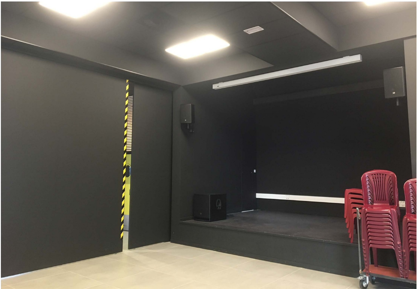
Scène avec les panneaux coulissants fermés.