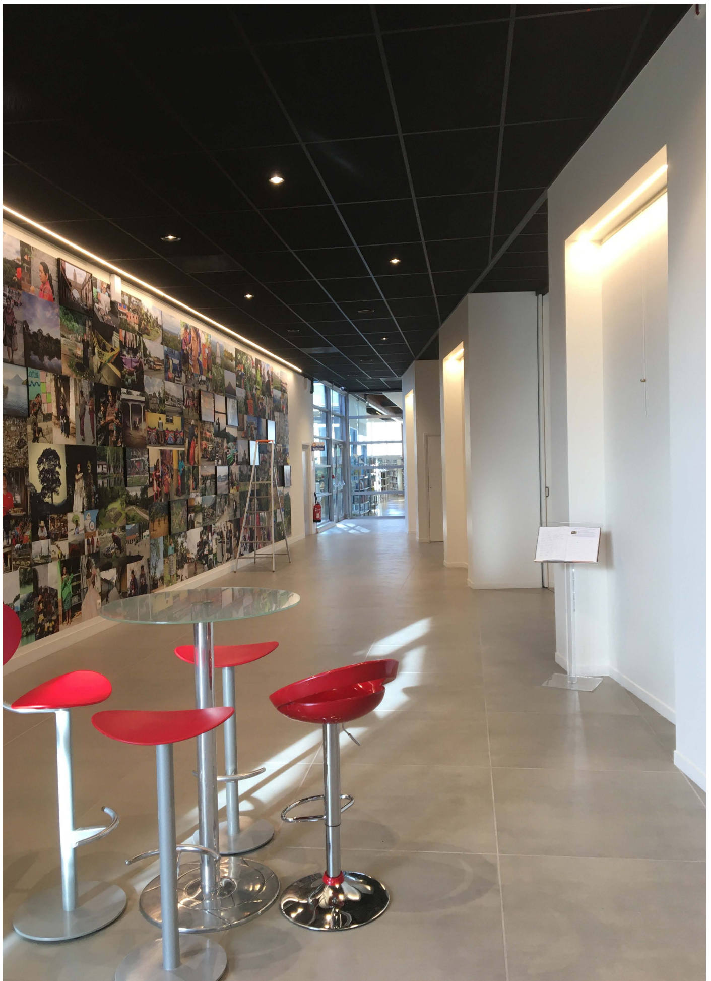
Grand mur d'exposition dans le hall à gauche. Alcôves avec les cloisons fermées à droite.