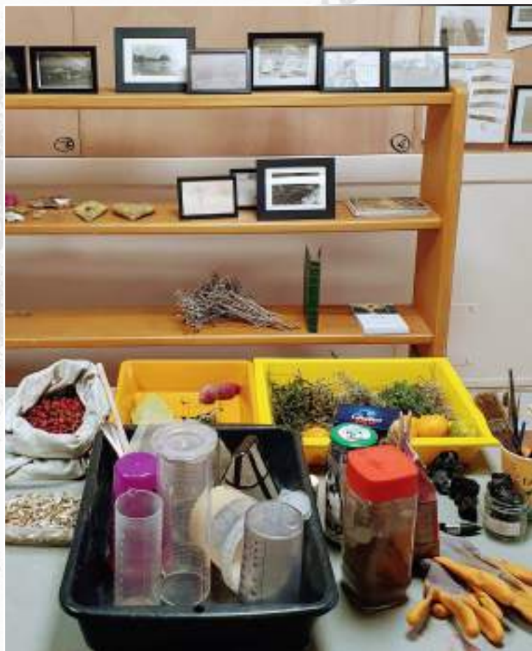
Atelier de Sandy Ott

La Ville de Six-Fours s'engage à attribuer aux artistes une bourse de résidence à hauteur de 44€ par jour soit 1320€ pour 30 jours.