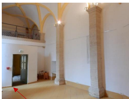
Entrée de la chapelle