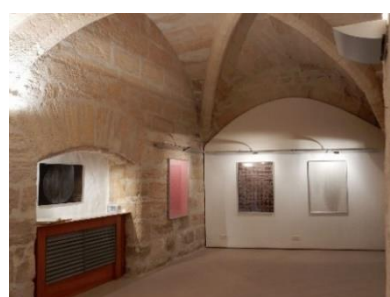
Salle d'exposition à la médiathèque d'Uzès