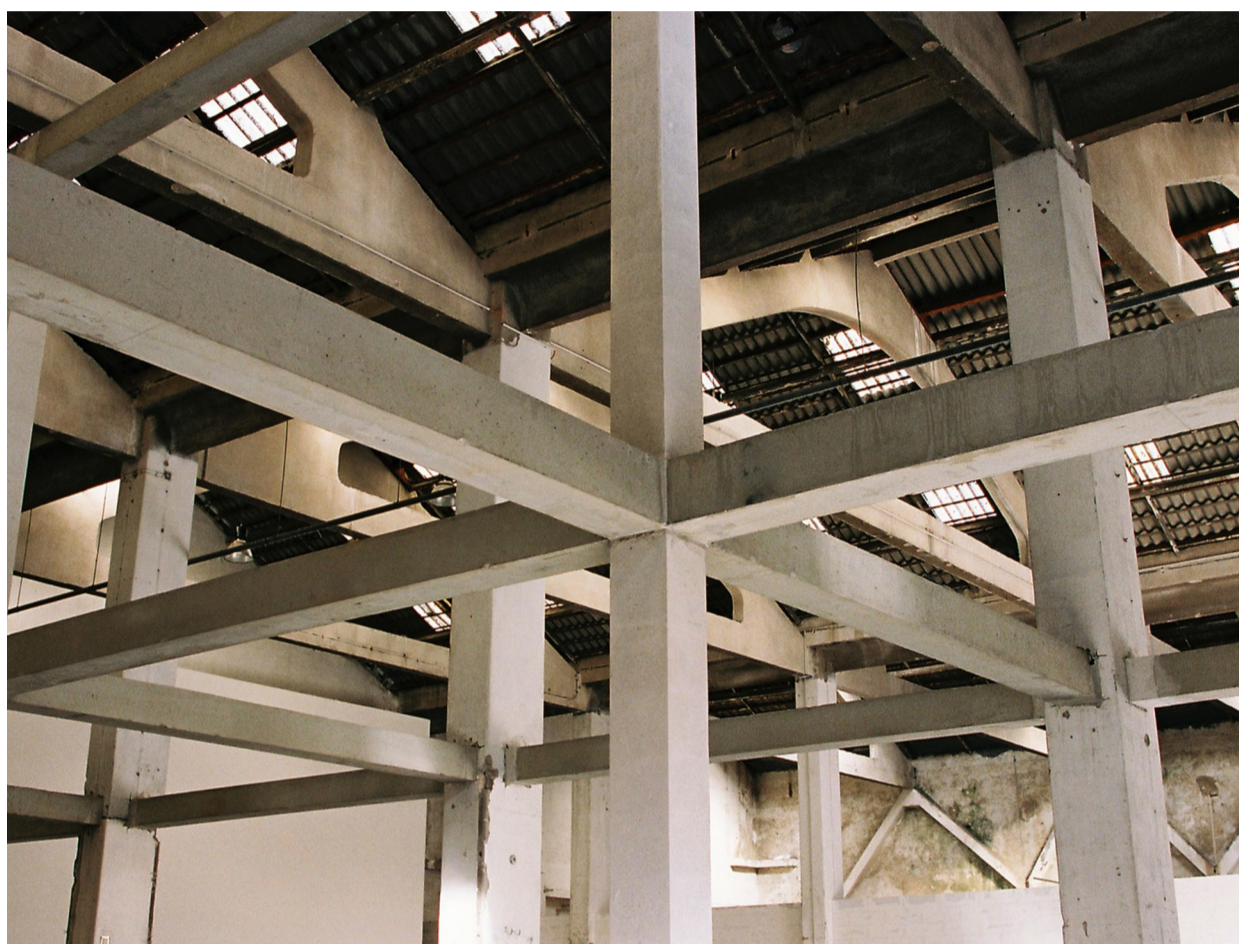
Vue architecturale, ateliers Jeanne Barret