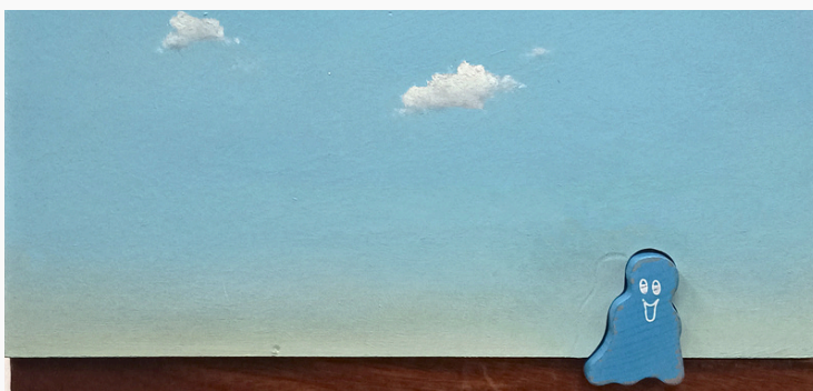
Sosthène Baran Fantôme Acrylique, huile sur toile et pièce en bois peinte - 23,5 x 33x3 cm