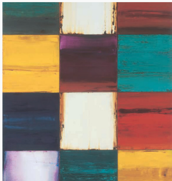
GUK Dae Ho Sans titre Huile sur toile - 195 x 150 cm

Seules les premières 300 candidatures seront retenues.