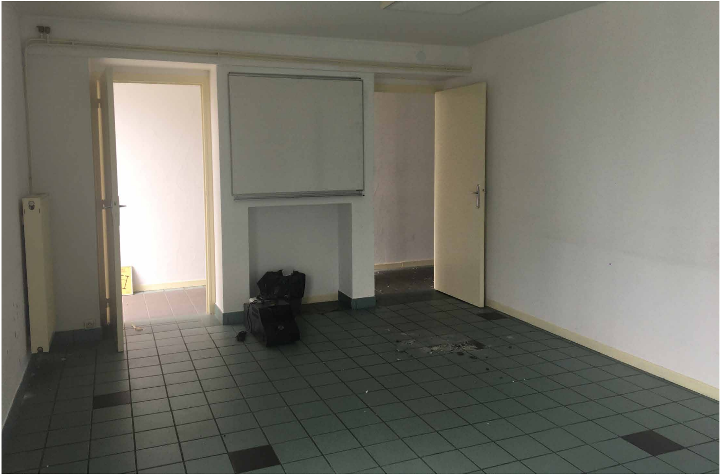
salle de cours à gauche du plan