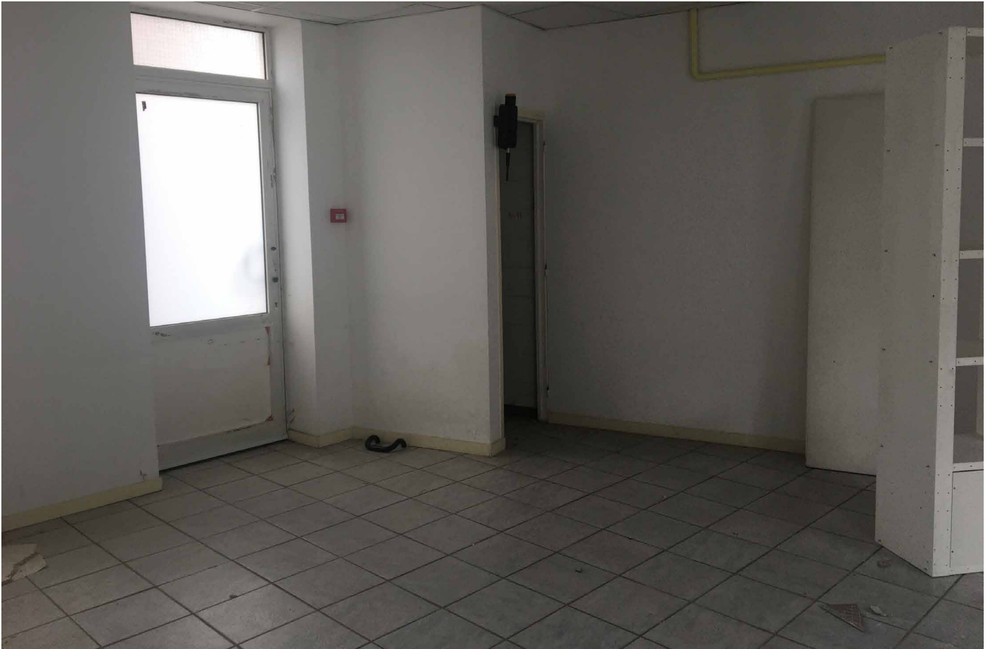
ces 3 images : salle du fond (noté sallee de cours à droite du plan)