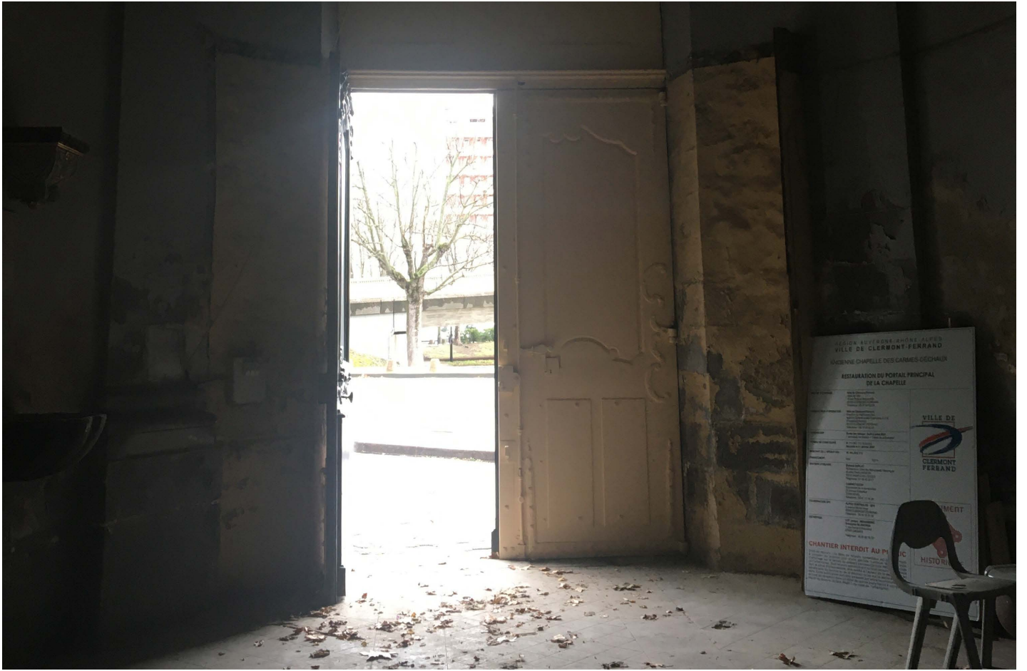
entrée et vôte