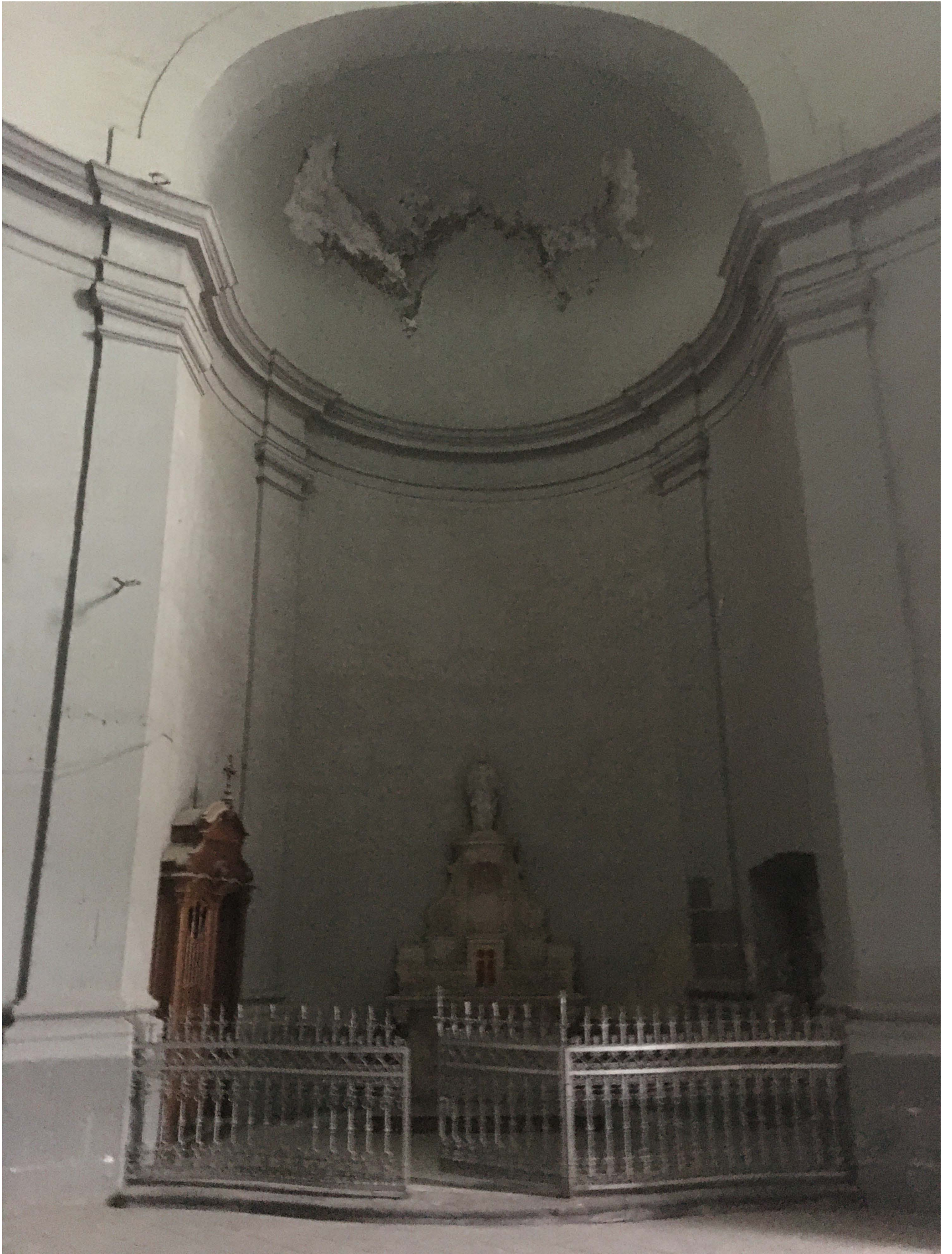
aille sud avec confessionnal en bois (ne pas dégradé)