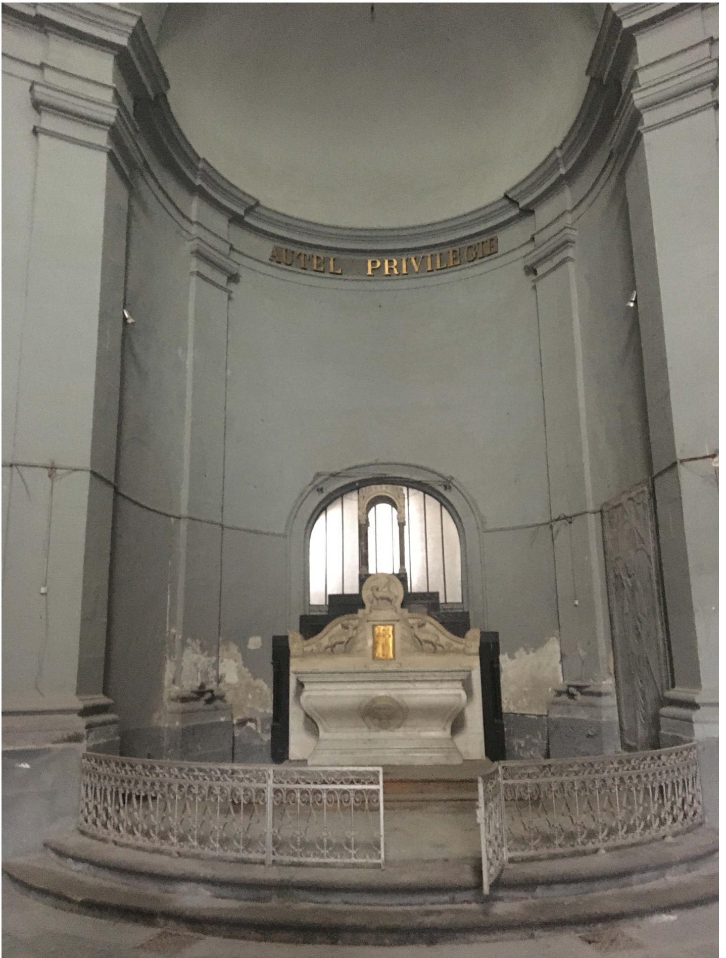
aille ouest (entrée dans l'arrière salle derrière l'autel)