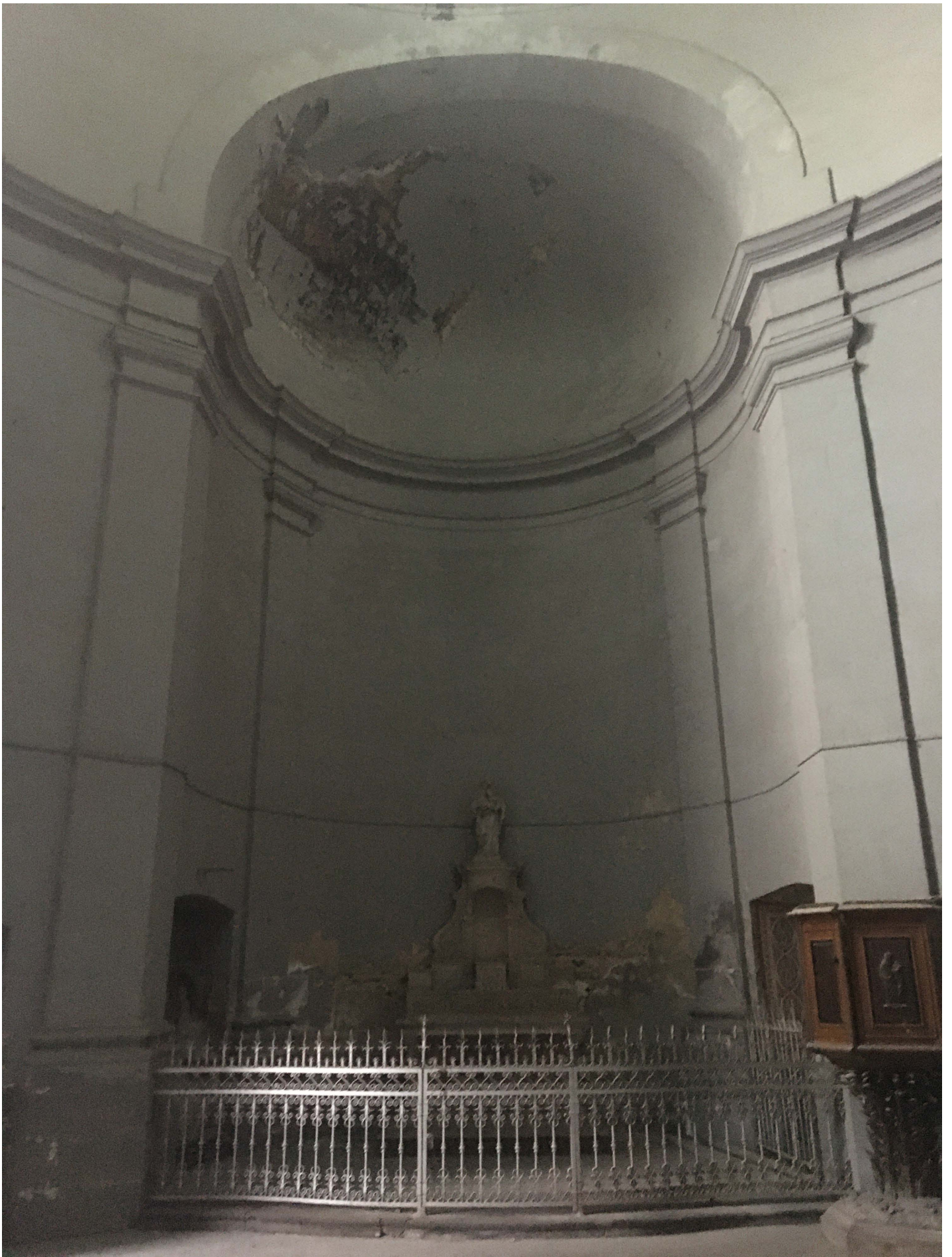
aille nord avec petite chaire en bois