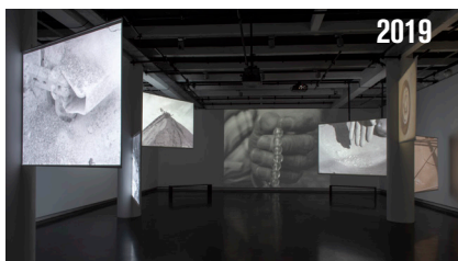
Yasmina Benabderrahmane, vue de l'exposition - La Bête, un conte moderne . 2020 © ADAGP, Paris, 2021