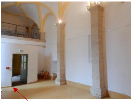
Entrée de la chapelle