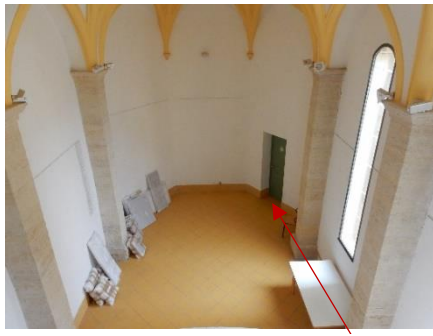
Cuisine de la chapelle