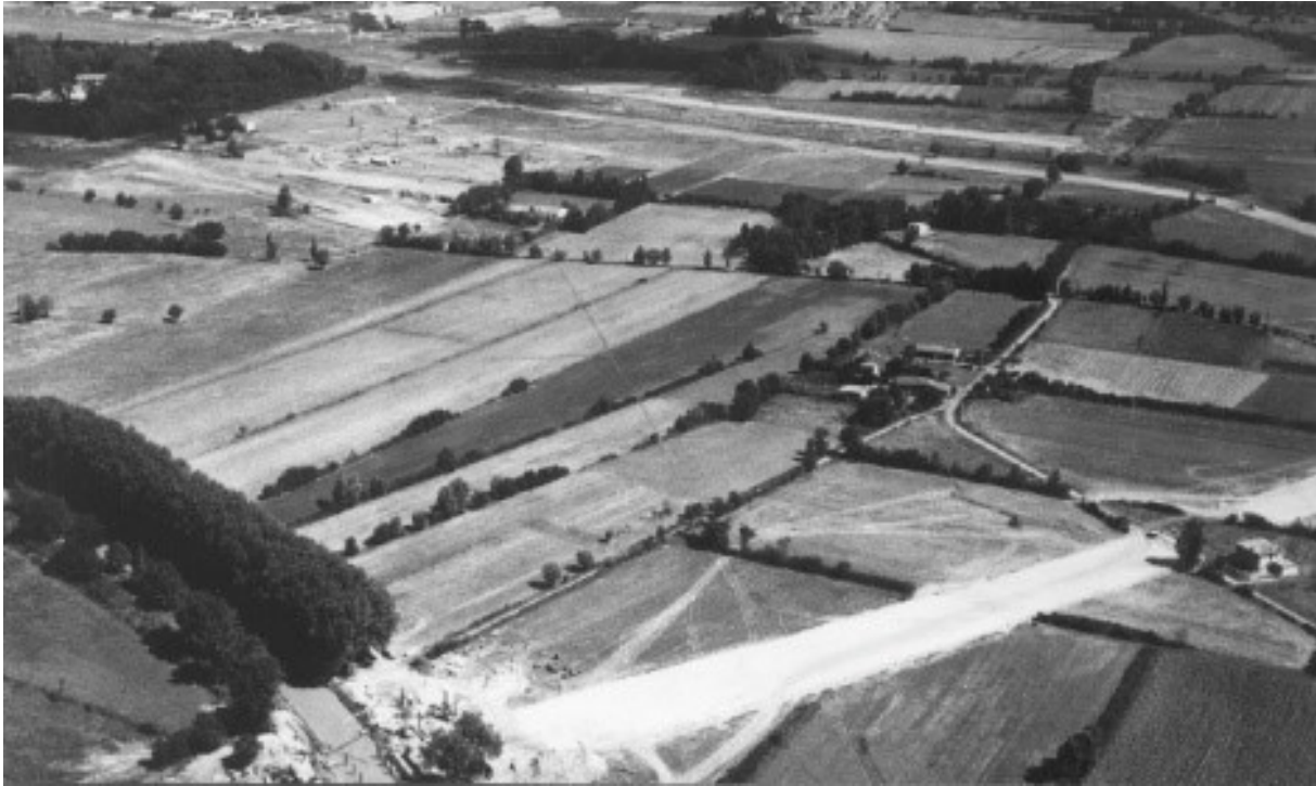
Photographie du futur emplacement du CST en 1965