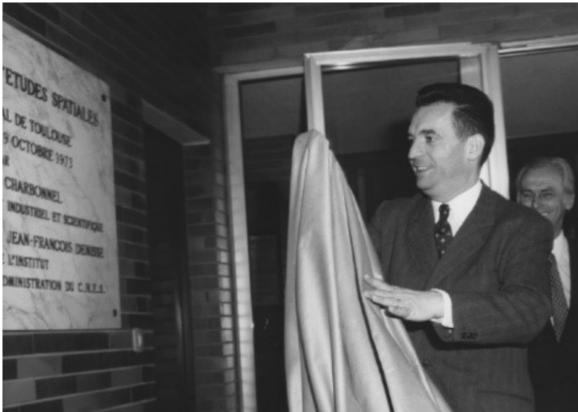
Photographie de l'inauguration du CST le 29 octobre 1973 par Jean Charbonnel, ministre du développement industriel et scientifique