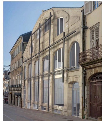
Projet par le cabinet d'architectes Jakob+MacFarlane.