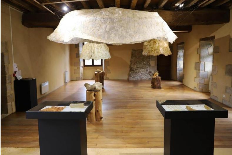
Exposition « Jonas » Thibault Philip Résidence 2022 @J-M Wiedenkeller

L'artiste produira des œuvres qui feront l'objet d'une exposition dans la salle Noël Mars de l'Abbaye située au 1 er étage.