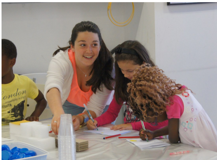
Atelier dans le cadre du PEDT au Pavillon Blanc Henri-Molina