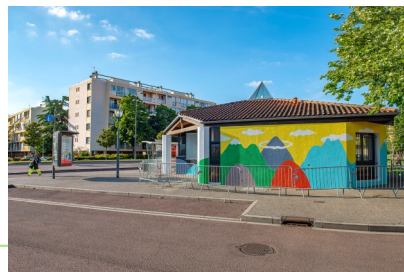
Maison du projet Quartier Val d'Aran

Le projet de destruction de la passerelle en 2022 permettra une continuité entre la place du Val d'Aran et le centre-ville. Il crée de l'inquiétude et de l'excitation auprès des habitants. L'ouverture du quartier sur la ville aura une influence sur leur quotidien en modifiant leurs habitudes. Il est donc nécessaire qu'ils deviennent acteurs de ce projet.