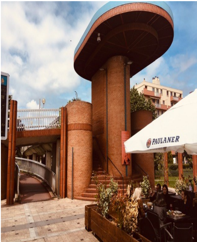
La passerelle qui relie la place du Val d'Aran au centre ville Photo Ville de Colomiers.