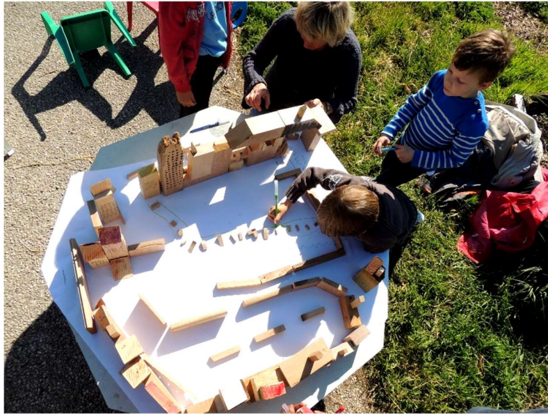
Workshop – mai 2015.