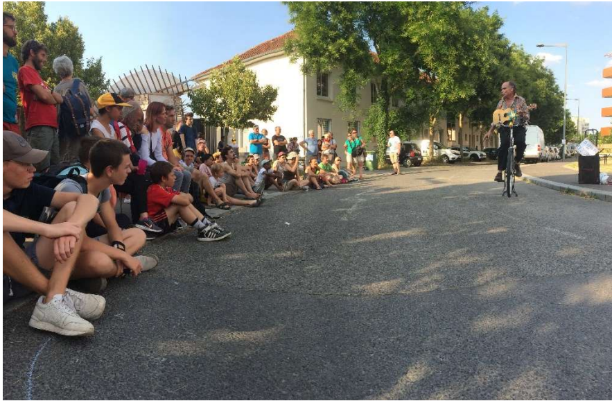
Brasserie citoyenne – juillet 2018.