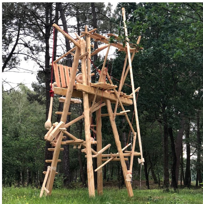
Mathieu Archambault de Beaune : Cheval, cheval, cheval, ni oui ni non - 2018