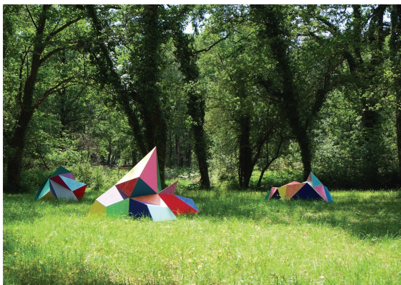
Elodie Boutry : Sous-bois - 2018