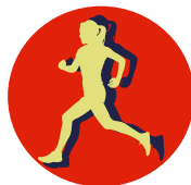
LA VERRIE'TABLE 7 km, 12 km