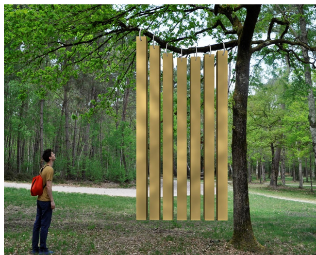
Camille Techer : the size of the container - 2019