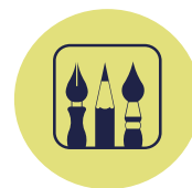
EXPO GRAND AIR