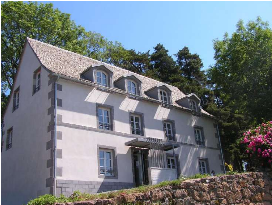
Maison Garenne - Saint-Sauves d'Auvergne

Les services culturels occupent des espaces publics dédiés : médiathèque à Tauves et Rochefort-Montagne avec un réseau intercommunal de bibliothèques qui se développe, ludothèque à Bagnols et Mazayes, salle de spectacle La Bascule à Tauves, Maison Garenne pour résidences d'artistes à Saint-Sauves d'Auvergne. La construction d'une saison culturelle intercommunale annuelle pour tous publics et scolaires, des expositions , des manifestations d'envergure, le soutien technique et financier aux associations, etc. sont autant d'activités proposés pour la population locale.