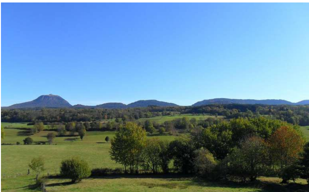
Chaîne des Puys - faille de Limagne - Patrimoine mondial de l'UNESCO

55 minutes sont aujourd'hui nécessaires pour se rendre, par la route, du nord au sud de ce territoire très étiré.