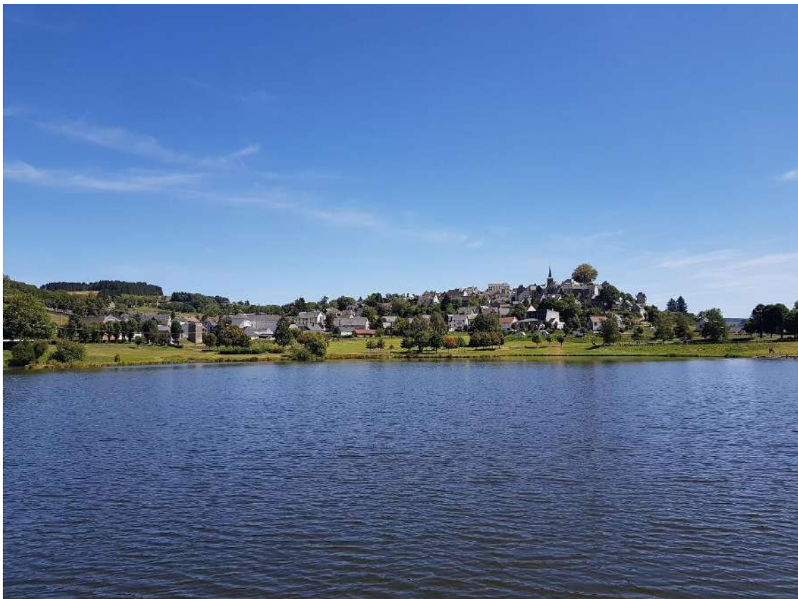
Lac de La Tour d'Auvergne

Rochefort-Montagne et La Tour d'Auvergne sont alimentées par des réseaux de chaleur bois. La filière bois-énergie est encore peu exploitée.